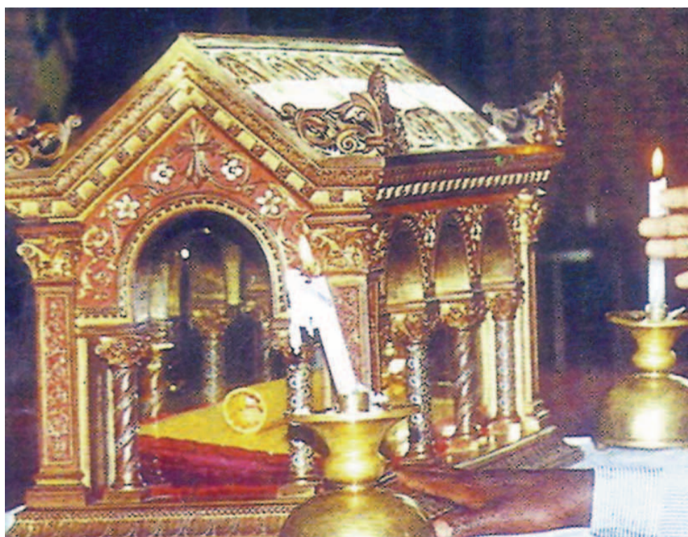
Las reliquias de Margarita María han visitado ya diversos países.

El cuerpo de santa Margarita se ha venerado desde entonces en la Capilla de las Apariciones de Paray-le-Monial, hasta que en 1999 un obispo africano, entusiasmado por la devoción, pidió la peregrinación de parte de las reliquias por su país. Desde entonces hay una pequeña urna itinerante, constituida con motivo de su canonización, que viaja por todo el mundo como signo de la santidad y «excelencia divina» que resplandece en la vida de santa Margarita María de Alacoque. Los impulsores de esta práctica devocional sugieren además la veneración de las reliquias con exposición del Santísimo, algo a lo que la propia santa, invitada