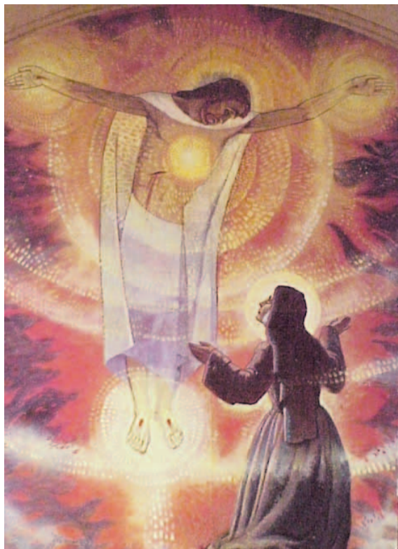
Fresco de la Capilla de las Apariciones en Paray-le-Monial.